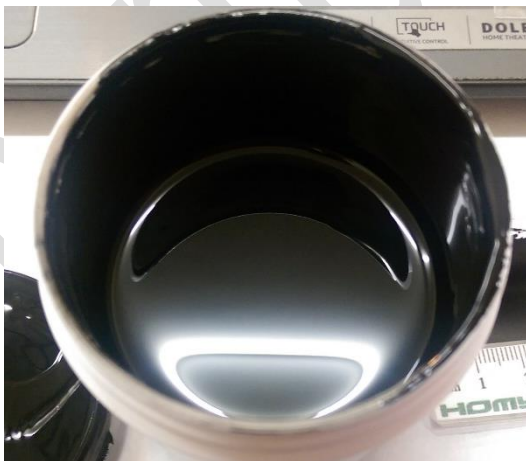
圖二：還在罐內的導電塗料