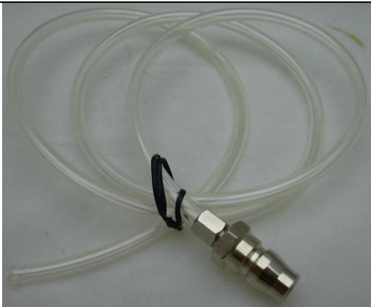
二分快插氣壓輸入接管